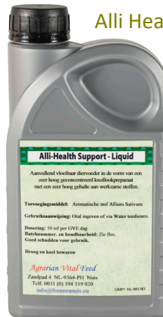
Alli Health Support - Liquid